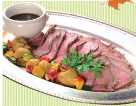
前沢牛のローストビーフ 7,000円(税込7,560円)