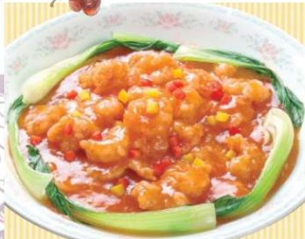
エビチリソース煮 4,000円(税込4,320円)