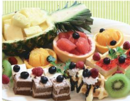
デザート・フルーツ盛 4,000円(税込4,320円)