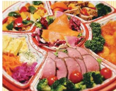
オードブル 5,000円(税込5,400円)