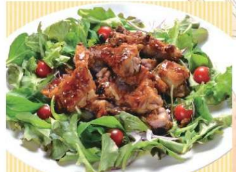
鶏南蛮野菜添え 4,000円(税込4,320円)

●お料理は4~5人前となります。 ※奥州市内・金ヶ崎町内限定、2皿からお届けします。 ご利用日の3日前までにお申込みください。