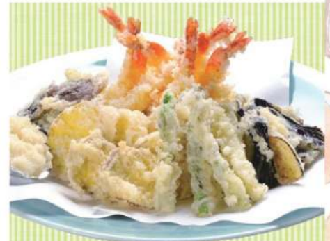
天婦羅盛合わせ 4,000円(税込4,320円)